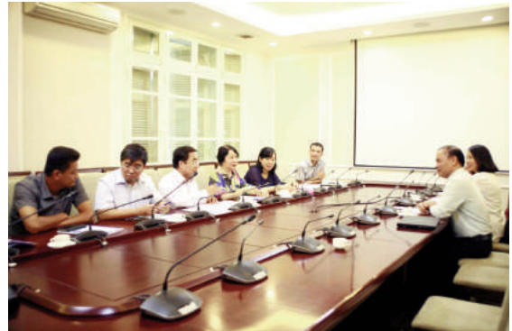
Toàn cảnh cuộc họp

Kết thúc đề tài, nhóm nghiên cứu đã hoàn thành các sản phẩm theo Hợp đồng ký với Bộ