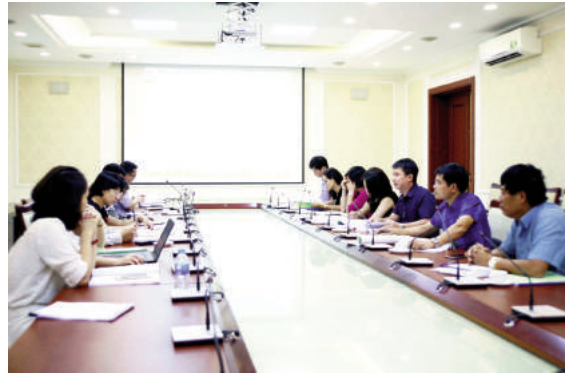
Toàn cảnh cuộc họp

Kết thúc đề tài, nhóm nghiên cứu đã hoàn thành Báo cáo tổng kết gồm 3 chương: Tổng quan kinh nghiệm của một số quốc gia, tổ chức quốc tế về lựa chọn nhà thầu trong hoạt động xây dựng; thực trạng cơ chế, chính sách liên quan đến lựa chọn nhà thầu trong hoạt động xây dựng tại Việt Nam; đề xuất những nội dung