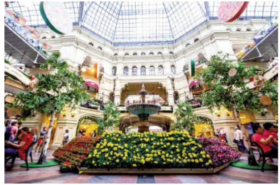
H2: Những vườn cây xanh bên trong Trung tâm thương mại Moskva (Nga)

Các tác giả bài viết đặt mục tiêu tìm kiếm sự