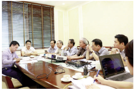
Toàn cảnh cuộc họp

Nhằm nâng cao chất lượng Báo cáo thuyết minh tổng kết đề tài và dự thảo TCVN “Đất xây dựng - Phân loại”, các chuyên gia phản biện và thành viên Hội đồng KHCN chuyên ngành Bộ Xây dựng đóng góp các ý kiến, giúp nhóm nghiên cứu tiếp thu, chỉnh sửa. Hội đồng đánh giá cao chất lượng sản phẩm đề tài, tuy nhiên nhóm nghiên cứu Viện IBST cần xem xét đổi tên tiêu chuẩn thành “Đất đá xây dựng - Phân loại” cho phù hợp với nội dung dự thảo tiêu chuẩn và phù hợp thực tế; rà soát, sử dụng chính xác và thống nhất các thuật ngữ chuyên ngành; xem lại một số bảng biểu, hình vẽ đảm bảo chính xác, hợp lý hơn đồng thời chỉnh sửa,