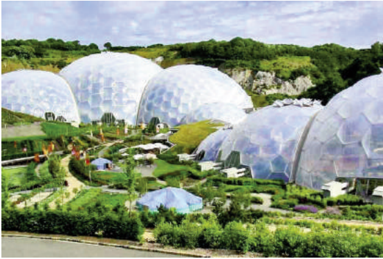
H3: Tổ hợp nhà kính Eden (Cornwall, Vương quốc

địa. Năm 1599, nhà kính đầu tiên tại châu Âu dành cho các loài thực vật nhiệt đới đã được xây dựng ở Leiden (Hà Lan). Năm 1848, khu vườn mùa đông House of Palm độc đáo đã được xây dựng trong Trung tâm nghiên cứu Kew Gardens (London). Lần đầu tiên thép và kính được sử dụng trong quá trình xây dựng. Trong vườn trồng khoảng 70% các loài cọ (palm) được khoa học biết đến. Công trình đã được công nhận là một kiệt tác kỹ thuật (H1).