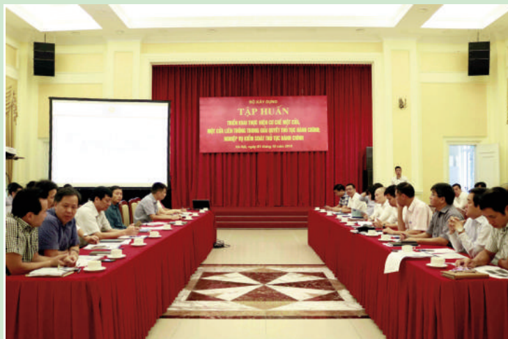
Toàn cảnh Chương trình tập huấn