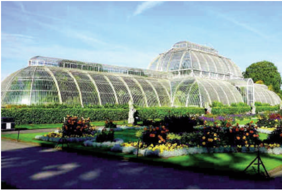
H1: Vườn mùa đông trong Trung tâm nghiên cứu Kew Gardens (London, Vương quốc Anh)