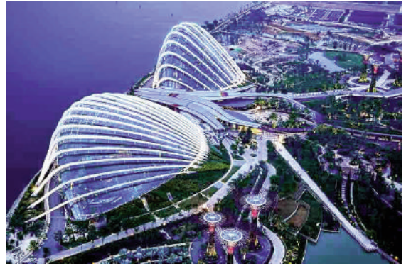
H4: Nhà kính -vườn sinh thái Marina Bay

Trong thế kỷ XIX, việc xây dựng các khu vườn mùa đông đã đạt bước tiến mới - kỹ thuật sản xuất khung hàng loạt để lắp kính cho ban