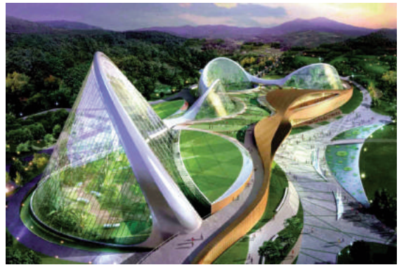
H5: Tổ hợp nhà kính Ecorium

Năm 2010, Văn phòng kiến trúc Samoo Architects & Engineers đã giành chiến thắng trong cuộc thi thiết kế Ecorium - tổ hợp các nhà kính nơi trình diễn các công nghệ tạo giới hạn cho các vùng khí hậu chính của Trái đất - từ vùng xích đạo và cận nhiệt đới đến vùng cận ôn đới và Bắc cực. Đó là một chuỗi dài những hình dáng hình học phức tạp thể hiện con đường quanh co, chủ đích để các tòa nhà không che khuất nhau. Dạo chơi dọc theo “con đường” này, khách tham quan có thể di chuyển qua những vùng khí hậu tự nhiên khác nhau, làm